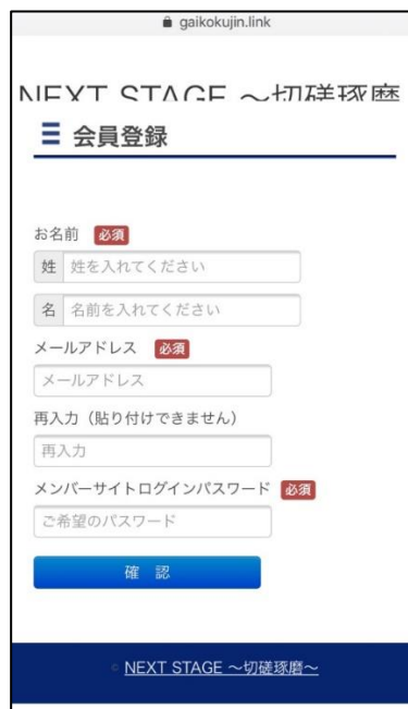
(メルマガ登録画面)