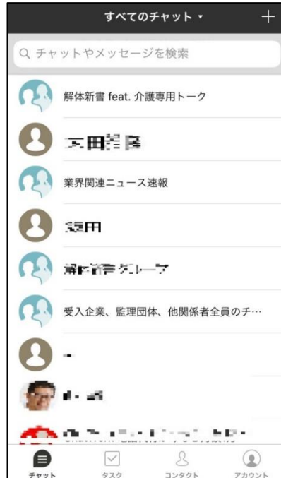
(チャットワークアプリ画面)